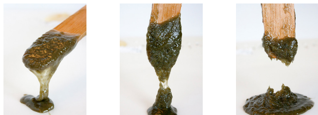
Esempio di addensamento con Z.Fix Fibra naturale

Applicazione dell'adesivo: mescolare ciascuno dei due componenti poi procedere alla loro accurata miscelazione nel rapporto indicato. Controllare ulteriormente l'assenza di polvere residua sulle superfici.